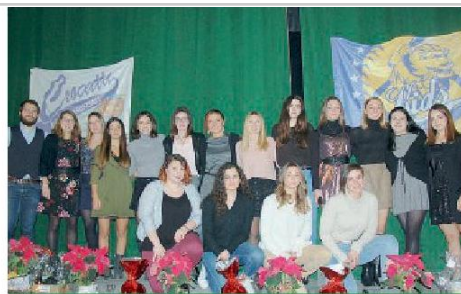
SERIE A2 SOFTBALL